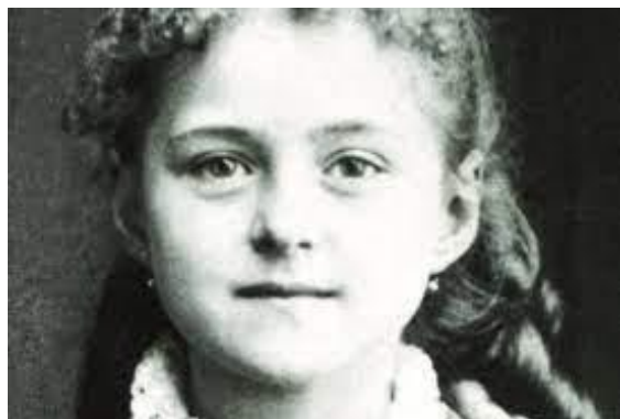
DIMANCHE DE LA MISERICORDE (voir page 3)