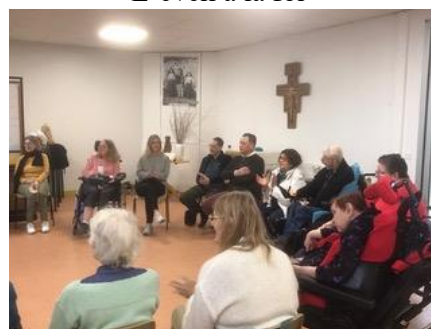
La communauté Espoir et Amitié de Foi et Lumière au Plessis-Bouchard