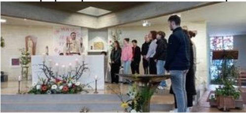
Les adolescents le lundi de Pâques

Nos assemblées, depuis le dimanche des Rameaux et de la Passion du Seigneur a vu un plus grand nombre d'enfants et d'adolescents participer activement à l'animation des célébrations de la Semaine sainte et de Pâques. Nous avons aussi été touchés par le nombre important d'adolescents présents pour la messe du lundi de Pâques. Merci à chacun et chacune d'eux, merci aux animateurs pour leur engagement et merci aux différentes équipes qui ont su leur faire de la place.