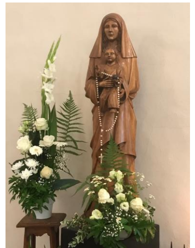
Vierge de l'église St-Nicolas