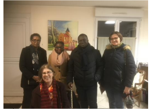
Équipe de Venez et Voyez en mars 2023