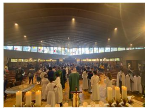
L'an dernier lors de la messe de rentrée, avec notre évêque Stanislas