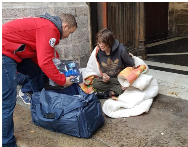
Maraude par des Scouts de France

Douce Lumière qui reconforte et approfondit la communion. Douce lumière qui nous permet de confier à Dieu cette partie obscure de nous-mêmes... Quelle libération et quel renouvellement une fois que nous avons accepté d'avancer sur ce chemin !